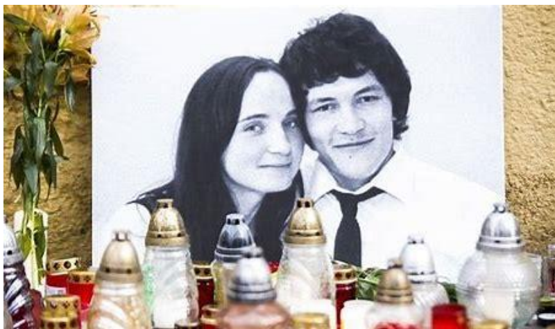
Gedenken an den ermordeten slowakischen Journalisten Ján Kuciak und seine Verlobte.

Im World Press Freedom Index 2019 von Reporter ohne Grenzen nehmen die Länder des Westlichen Balkans die Plätze 63 (Bosnien und Herzegowina), 75 (Kosovo), 82 (Albanien), 90 (Serbien), 95 (Nordmazedonien) und 104 (Montenegro) ein. Die Türkei liegt weit abgeschlagen auf Platz 157. Viele Journalist(inn)en sind Zielscheibe von Morddrohungen, körperlichen Übergriffen, Beleidigungen oder willkürlichen Verhaftungen und Verurteilungen. Die Nicht-Regierungsorganisation Regional platform for advocating media freedom and journalists' safety ( http://safejournalists.net ) listet allein in den Ländern des Westlichen Balkans seit 2014 insgesamt 543 gemeldete Übergriffe auf Journalist(inn)en. In der Türkei sitzen laut Reporter ohne Grenzen derzeit mindestens 35 Medienvertreter(inn)en in Haft.