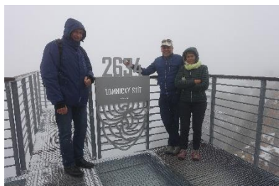
-7° auf der Lomnitzer Spitze