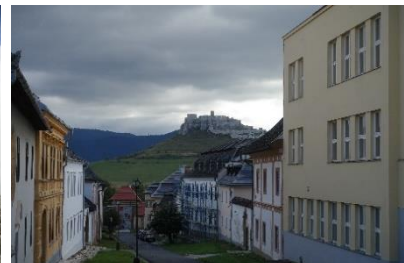
Die Zipser Burg