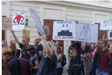
Frauen-Demo in Bratislava