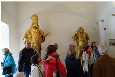
Burg von Kremnica