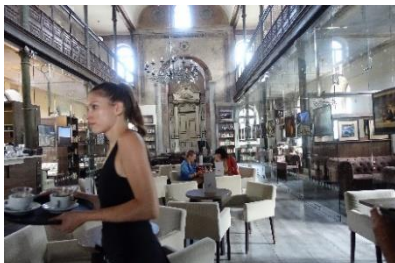
Kaffeehaus in der Synagoge in Trnava