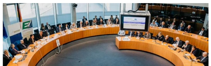
Vortrag und Diskussion im Deutschen Bundestag: Der westliche Balkan nach der Lösung der Namensfrage: Erfolge, Herausforderungen, Perspektiven. Von links: MdB Manuel Sarrazin, Nikola Dimitrov (Außenminister der Republik Nordmazedonien), Adelheid Wölfl (Der Standard).