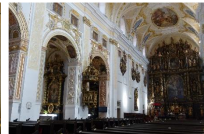
Kirchenschätze in Trnava