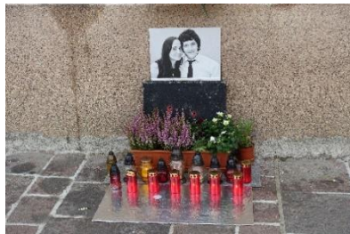
Gedenken an Jan Kuciak