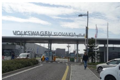
Volkswagenwerk bei Bratislava