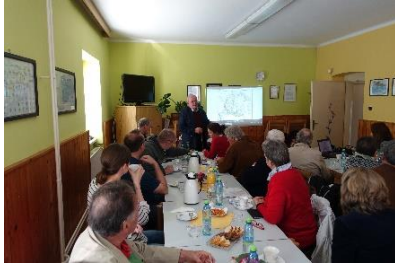
Karpatendeutsche Vereinigung in Kezmarok