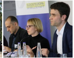
58. Internationale Hochschulwoche in Tutzing: Borders in Southeast Europe.