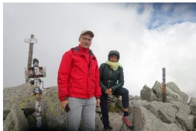
Chopok, Niedere Tatra