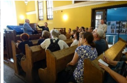
Synagoge in Komarno