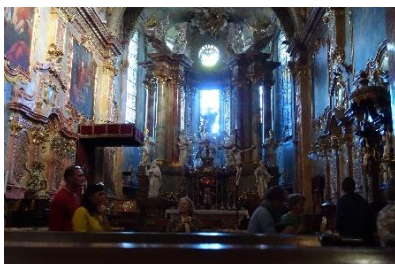
Kathedrale in Nitra