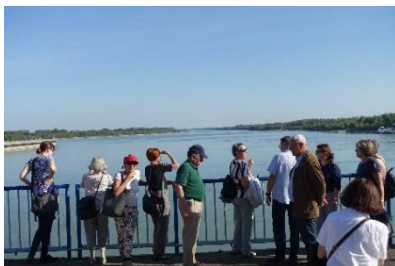
Donau-Wasserkraftwerk in Gabčíkovo