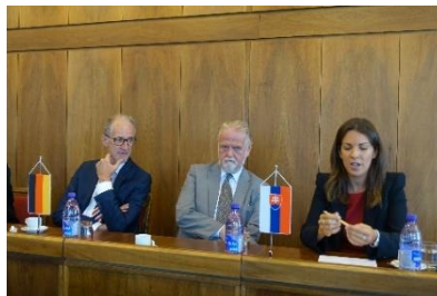
Fachgespräch im Slowakischen Parlament