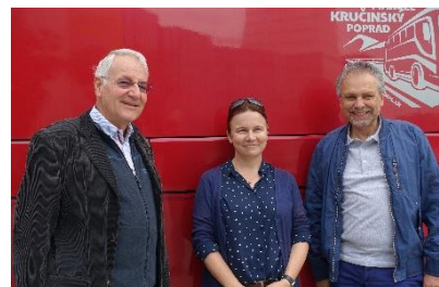
Reiseleitung: Weiss, Profantova, Brey

© Südosteuropa-Gesellschaft Widenmayerstr. 4980538 München Tel: +49 / 89 / 21.21.54-0 info@sogde.org / www.sogde.org